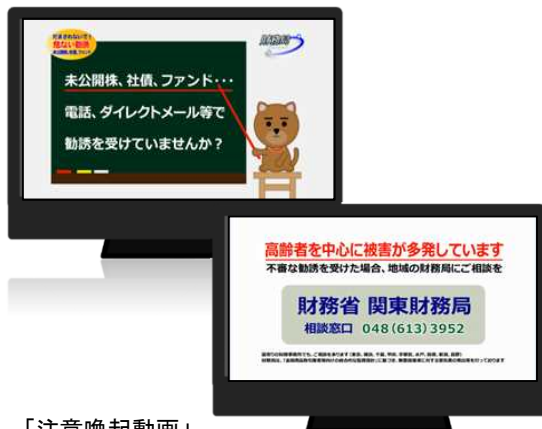
「注意喚起動画」 (ご協力：一般社団法人日本ケーブルテレビ連盟)