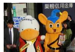
金融機関・警視庁等との街頭活動