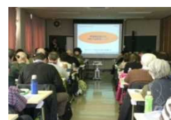
「彩の国いきがい大学」講演 (ご協力：公益財団法人いきいき埼玉)